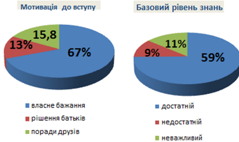
Рис. 1. Аналіз мотиваційної складової навчання англомовних студентів