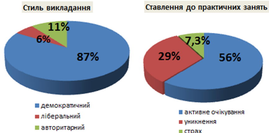
Рис. 2. Психологічні аспекти викладання англомовних студентів