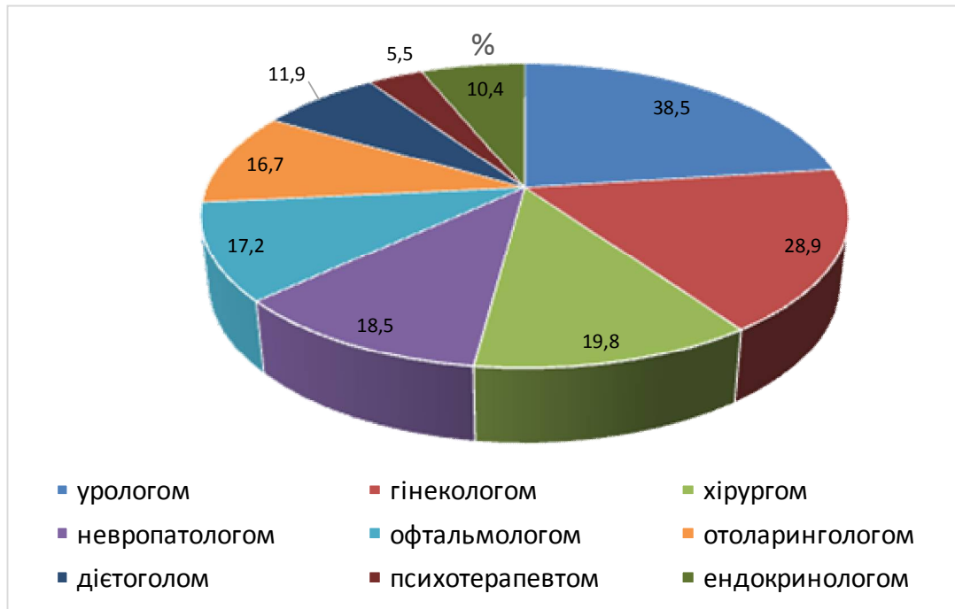
Рис. 1. Структура наданих консультацій спеціалістами

Великий штат вузьких спеціалістів дозволив проконсультувати пацієнтів і провести їм ефективну реабілітацію з урахуванням наявних супутніх патологій. Структура наданих консультацій спеціалістами зображена на рисунку 1.