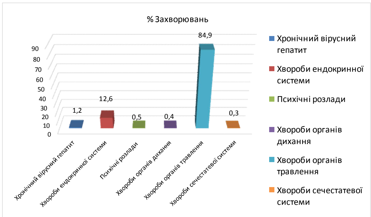
Рис. 3. Структура хворих по захворюваннях Відділення «Дністер».

27-28 вересня 2018 року в Моршині була проведена науково-практична конференція з міжнародною участю «Медична реабілітація у санаторно-курортних закладах України. Нові технології реабілітації хворих на курортах Європи. Сучасні вимоги в організації СПА комплексів на курортах та досвід використання СПА процедур у медичній реабілітації», присвячена 140-річчю курорту Моршин. Конференція є офіційним заходом МОЗ України і внесена до державного реєстру заходів, конгресів, симпозіумів та науково-практичних конференцій, які проводитимуться у 2018 році за № 200 від 26.12.2017р.