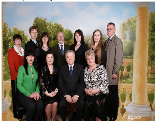
Колектив кафедри ендокринології з курсом ЛФК