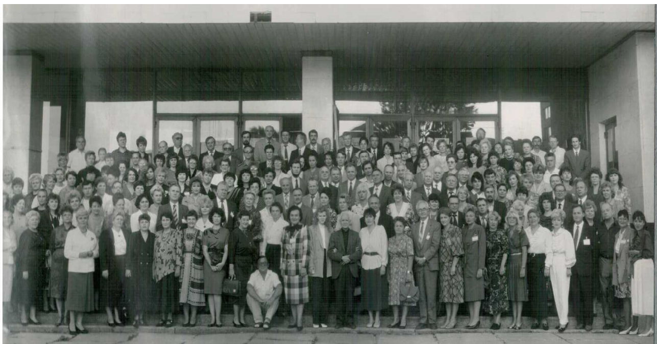
У з'їзд ендокринологів України 13-16 вересня 1994 р., м. Івано-